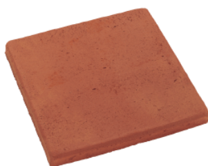
RT 12 Rött enfärgad