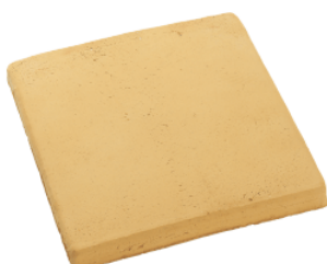
RT 10 Gul enfärgad

Golvtegel levereras obehandlat. Normalt uppstår inga förändringar på färgen med dessa behandlingar.